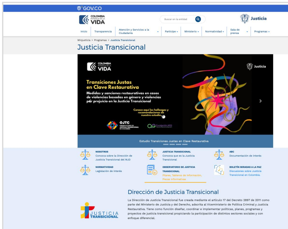
Imagen 1 Micrositio Dirección de Justicia Transicional

Para determinar la funcionalidad y efectividad al momento de consultar información en esta plataforma digital, se efectuaron una serie de pruebas por parte de la Dirección de Tecnología que permitieron confirmar datos sobre el tráfico en el sitio y la interacción con el Chatbot, proporcionando así indicadores del rendimiento y alcance del micrositio del Observatorio.