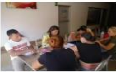
REALIZACIÓN DE INSCRIPCIONES PARA EL DIPLOMADO SEPT- 2019