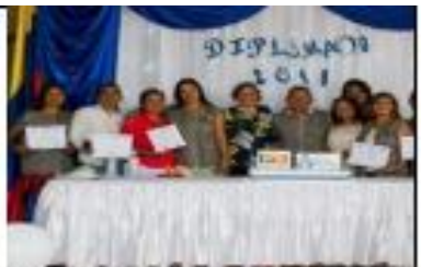
Ceremonia de Graduación Fecha: 07 de Diciembre de 2019.