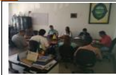
SOCIALIZACIÓN DEL PROYECTO ANTES LAS AUTORIDADES LOCALES SEPT- 2019