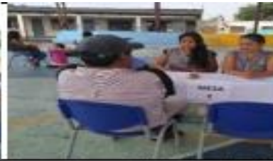
Jornada de conciliación: Audiencia de conciliación Fecha: 06 de Diciembre de 2019. Lugar Coliseo Escuela Central.