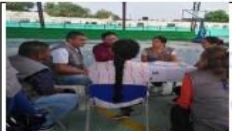
Jornada de conciliación: Audiencia de conciliación Fecha: 06 de Diciembre de 2019. Lugar Coliseo Escuela Central.