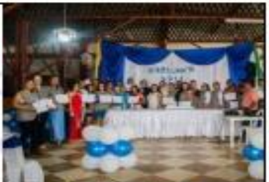
Ceremonia de Graduación Fecha: 07 de Diciembre de 2019. Lugar Auditorio de eventos la Cascada