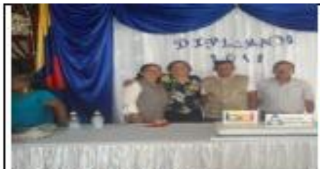
Ceremonia de Graduación Fecha: 07 de Diciembre de 2019.