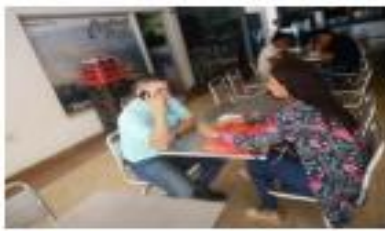
SOCIALIZACIÓN DEL PROYECTO AL PROMOTOR DE DESARROLLO