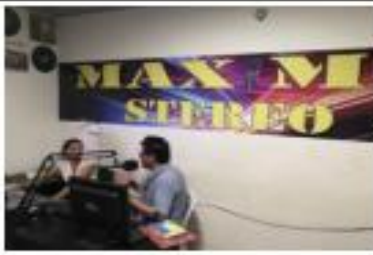
SOCIALIZACIÓN DEL PROYECTO A TRAVES DE LAS DIFERNTES EMISORAS DEL MUNICIPIO SEPT- 2019