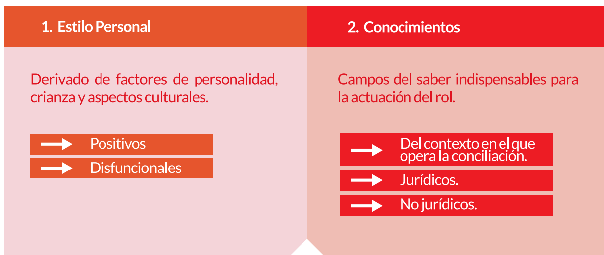
—Gráfica 2. Atributos deseables del Conciliador en Derecho

A continuación, se presentan los atributos deseables para un óptimo desempeño de los servidores/as públicos y Notarios en su calidad de conciliadores.