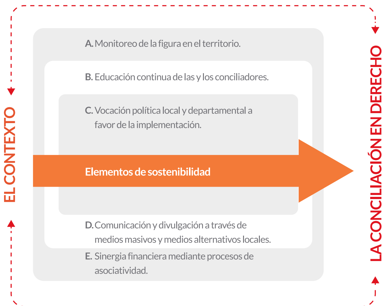
—Gráfica 3. Guía para la implementación de la conciliación en derecho.

En esta etapa es recomendable, realizar las siguientes actividades: